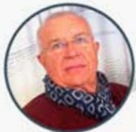
Joaquín Donat Hospital Clínico