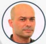
Jaume Morera Hospital La Pedrera