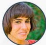
Lary Leon F. ATRESMEDIA