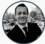
Florent Amion Vygon S.A.U.